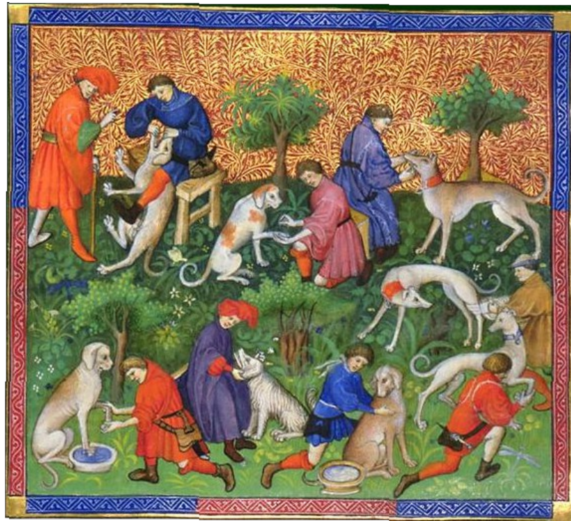
Gaston Phébus, Livre de chasse : Des maladies des chiens et de leurs conditions. France, Paris, XVe siècle. Paris, BnF, Dép. des manuscrits, Français 616 folio 40v http://classes.bnf.fr/phebus/grands/c16_616.htm