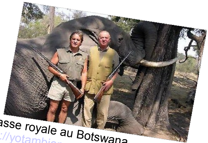
Chasse royale au Botswana http://yotambiensoyunareina.blogspot.fr/2012/04/las-redes-sociales-se-mofan-del.html